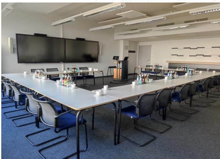
Beispiel Seminarraum Deluxpaket