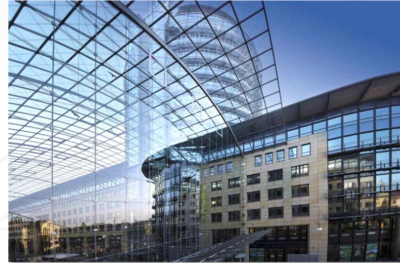
World Trade Center

Das World Trade Center Dresden besticht durch eine ausgesprochen gute Lage mit idealer Verkehrsanbindung. Das Gebäude liegt zentral in der Dresdner Innenstadt an der Kreuzung Ammonstraße/ Freiburger Straße. Mit dem Hauptbahnhof und dem Flughafen als wichtigste Verkehrsknotenpunkte und die optimale Anbindung an das öffentliche Verkehrsnetz, ist eine unkomplizierte und schnelle Anreise absolut gewährleistet . Genügend Parkmöglichkeiten sind in der Tiefgarage vorhanden. Für Gäste von außerhalb hält das Hotel Elbflorenz als direkter Nachbar ausreichend Übernachtungsmöglichkeiten bereit.