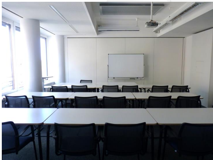
Beispiel Seminarraum Basispaket